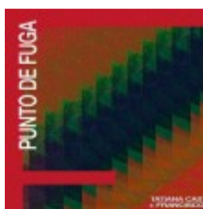
Punto de Fuga Volumen IV en Roseti