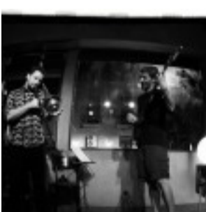
Noche Instantánea en Roseti