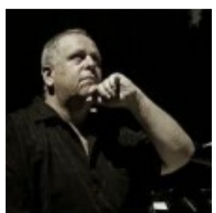
Buenos Aires Jazz 2011: No hay 3 sin 4