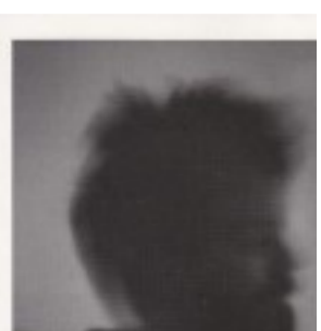
Encuesta 2011 - Músicos Argentinos